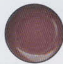
Nude 11393 Medium Violet