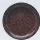
Nude 11398 Glimmer Coffee Hot Chili