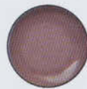
Nude 11394 Light Violet