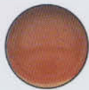
Nude 11391 Latte Macchiato