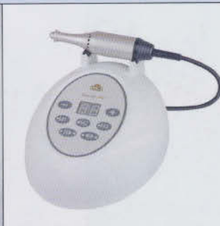
LCN Wilde Cosmetic