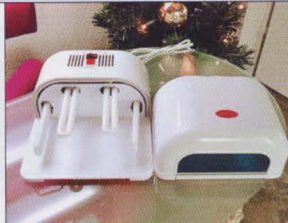
Academia more than nails